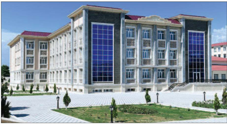
1924-cü il yanvarın 18-də Naxçıvan MSSR Mərkəzi İcraiyyə Komitəsinin qərarı ilə Xalq Səhiyyə Komissarlığı yaradılmış və səhiyyə sisteminin dövlət tərəfindən tənzimlənməsinin əsası qoyulmuşdur.

Ölkəmizdə səhiyyənin cəmiyyət və dövlət həyatında ən mühüm sahəyə çevrilməsi, onun inkişaf və tərəqqisi xalqımızın ümummilli lideri Heydər Əliyevin adı ilə bağlıdır. Həyatını ölkəmizin yüksəlişinə və insanların xoşbəxtliyinə həsr edən ümummilli liderimiz səhiyyəni cəmiyyət və dövlət həyatında ən mühüm sahə kimi qiymətləndirərək demişdir: “Səhiyyə bizim üçün, hər bir cəmiyyət və dövlət üçün çox lazımlı, həyatın bütün sahələrini əhatə edən sahədir” .