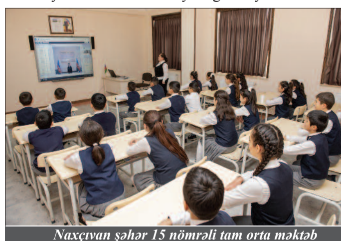
Naxçıvan şəhər 15 nömrəli tam orta məktəb

başlayaraq təcavüzkar erməni daşnaklarının azərbaycanlılara qarşı müxtəlif illərdə törətdikləri dəhşətli cinayətlərin izləri bu eksponatlarda öz əksini tapıb. Azərbaycanın suverenliyi və ərazi bütövlüyü uğrunda döyüşlərdə həlak olanların xatirəsinin əbədiləşdirildiyi muzeydə şəhidlərin fotosəkilləri, şəxsi sənədləri, döyüş yollarını əks etdirən materiallar saxlanılır. Eyni zamanda bu mədəniyyət müəssisəsində qəhrəmanlıq tariximizin müxtəlif dövrlərinə aid kitablar nümayiş etdirilir. Xatirə Muzeyində azərbaycanlılara qarşı 1905-1907-ci, 1918-1920-ci