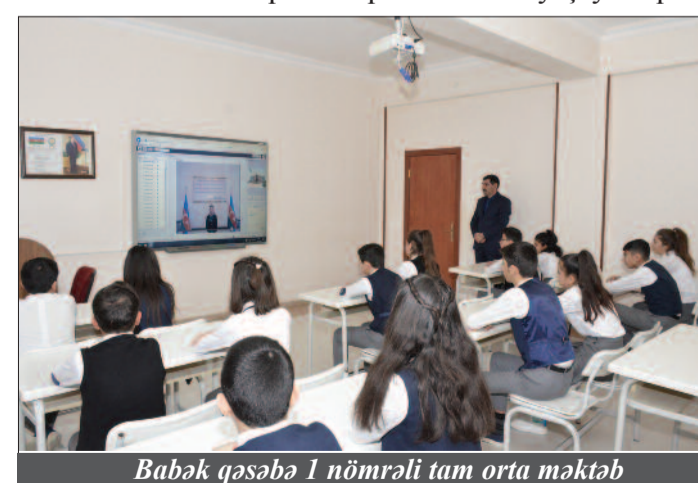
Babək qəsəbə 1 nömrəli tam orta məktəb

runda döyüşlərdə həlak olanların xatirəsinin əbədiləşdirildiyi muzeydə ümummilli lider Heydər Əliyevin 20 Yanvar faciəsi ilə bağlı imzaladığı fərmanların surətləri, şəhidlərin fotosəkilləri,